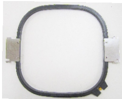
4 x Rahmen 295x295mm