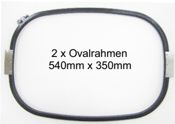
2 x Ovalrahmen 540mm x 350mm