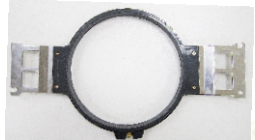
4 x Rahmen 180mm