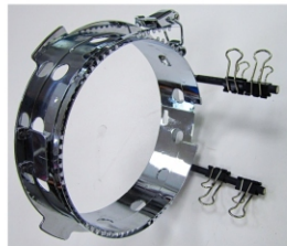
Kappenrahmen 4 x