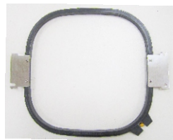
2 x Rahmen 295x295mm