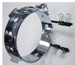
Kappenrahmen 2 x