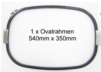
1 x Ovalrahmen 540mm x 350mm